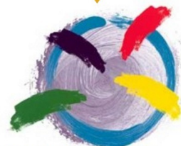
Fondazione Hirschmann Integrazione

Rotary Stiftung Zürich Hans Vontobel Fond